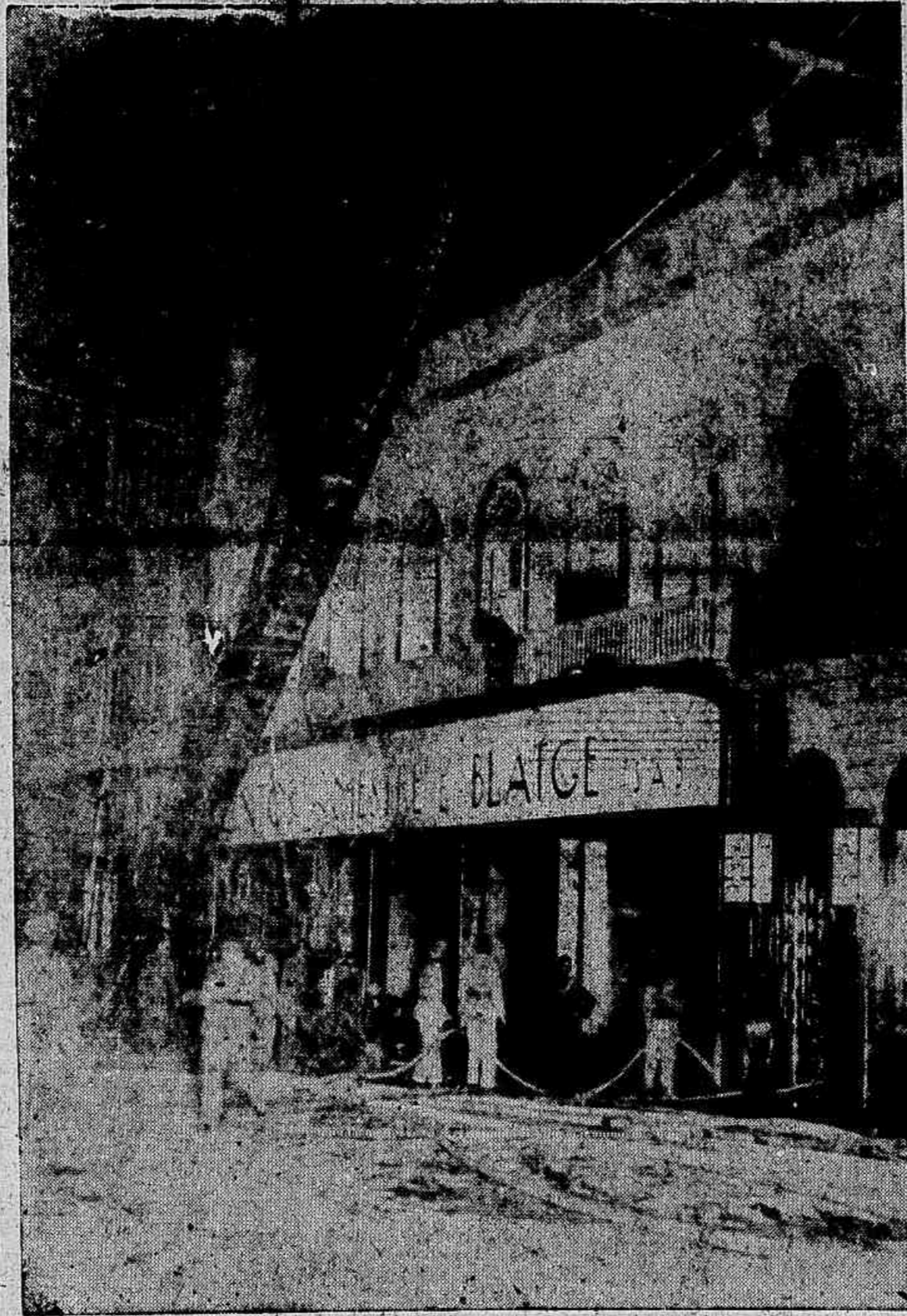
Aspecto da fachada dos estabelecimentos Mestre & Blatgé, durante o sinistro

Numerosas mangueiras foram installadas na luxuosa casa de diversões afim de combater a invasão das chammas naquello sector.